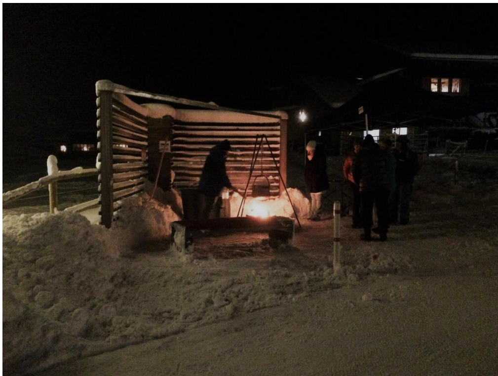
Christbaumapéro beim UNESCO Infopunkt