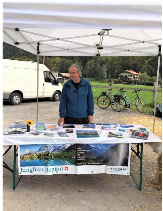
Stand von Stechelberg Tourismus