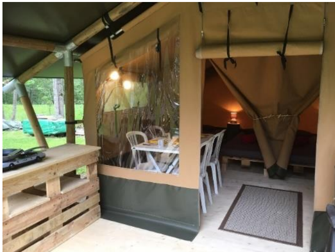
Innovationen auf dem Camping Rütli - Glamping.