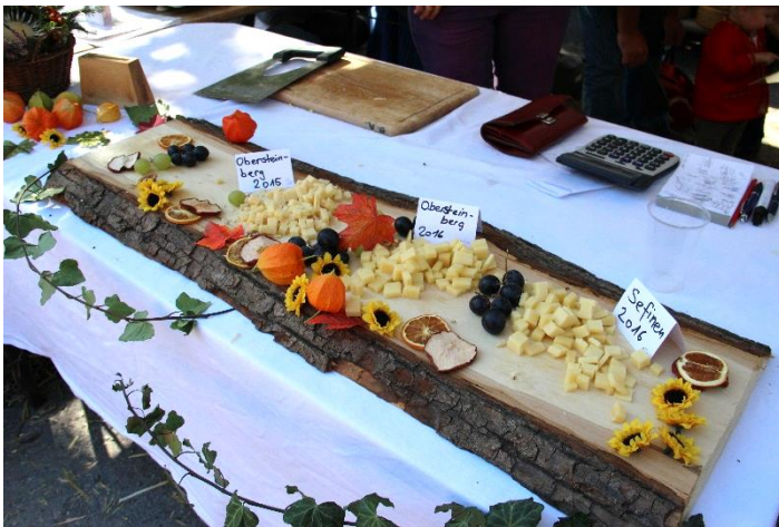
Vielfältiges einheimisches Schaffen

Christbaumapéro: Auch dieses Jahr fand wieder ein Christbaumapéro bei der Rütli statt. Der Glühwein und die Weihnachtsguetzli wurden von Stechelberg Tourismus gesponsert. Trotz Kälte und Schnee war der Anlass gut besucht und könnte zur Tradition gemacht werden.